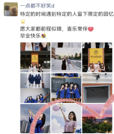
一点都不好美d 特定的时间遇到特定的人留下限定的回忆

如何调整心态、如何重新出发。值得感恩的是，我在家人的爱与支持中成长，在老师们的智慧和热情中求知，在朋友的关怀中倾诉，他们所付出的一切让我感到无比温暖，也让我拥有一颗勇敢的心，指引我前行。 是终点，亦是起点。在未来的旅途中，我们或许会遇见更加绚丽的风景，或许会经历更加困难的挑战，或许会遇到更多有趣的人或事。未知是神秘且具有吸引力的，祝愿踏上未知旅途的每一位毕业生无论何时何地都拥有热爱生活的勇气，领略无限美好光景。 最后，我想把看到的一句话感触很深的话分享给大家。祝生命离岸掌舵，平波致远。