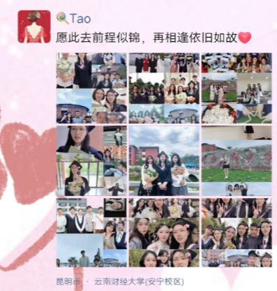
Tao 愿此去前程似锦，再相逢依旧如故

都能在各自的领域里发光发热，为社会做出自己的贡献。愿我们都能保持那份初心和热情，不断追求自己的梦想和目标。在未来的日子里，让我们携手共进，共同创造属于我们的辉煌！ 再到鲜花弥漫的原野，是我们梦想的彼方。 在微风吹拂的盛夏，我们奔向各自的前方，别离是新的序章，愿出走半生，归来仍是少年，愿赤子心不灭，一身热血与山海共谋风月！