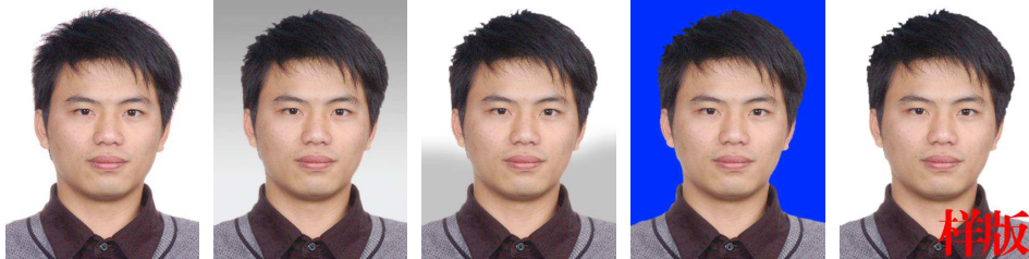
正确 背景不为纯白 背景处理不干净 其它颜色背景 相片中有字体