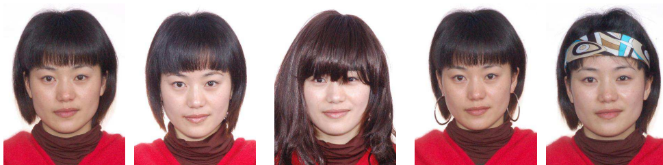
正确 双耳不可见 头发挡住眉毛眼睛 戴耳环 戴发夹