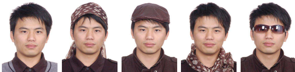
正确 扎头巾 戴帽子 围围巾 戴墨镜