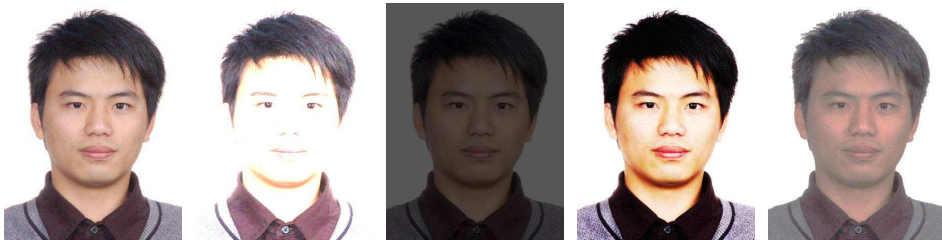
正确 曝光过度 曝光不足 对比度过大 对比度过小