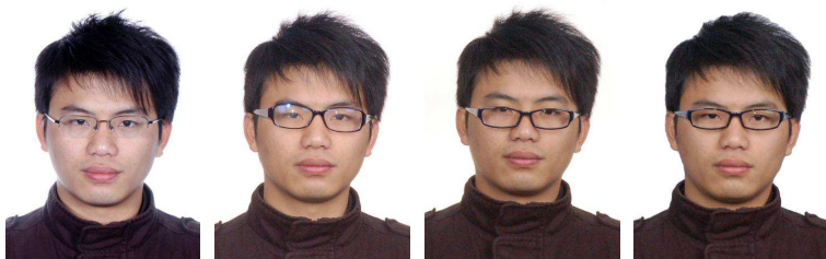
正确 镜片反光 镜框挡住眼睛 镜框过宽颜色过深