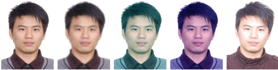
正确 人像模糊 人像偏青 人像偏蓝 人像反光