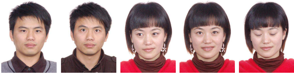
正确 眼睛睁开不自然 眼睛向左看 眼睛向上看 闭眼睛